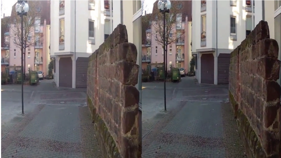
Abbildung 3: Ansicht Side-by-Side 3D-Video

„Seite an Seite“ angeordnet sind. In der Praxis kann diese Darstellung beim GoPro Studio durch einfaches Auswählen erreicht werden. Sind andere Videoprogramme im Einsatz, so ist das Erstellen solcher Videos durch das Halbieren der Videobreite möglich. Die Höhe der Videos bleibt unverändert. Auf den Vorgang des Halbierens der Videobreite erfolgt anschließend eine Anpassung der Position der beiden Videos. Da beide Ausgangsvideos zu einem Video zusammengefügt werden sollen, müssen das Video der linken Kamera am linken Bildrand und das der rechten Kamera am rechten Bildrand ausgerichtet werden. Es entsteht ein Video, welches in der Breite zweigeteilt ist und scheinbar zweimal das Gleiche nebeneinander zeigt – solange der Betrachter es auf einem normalen Bildschirm ansieht. In Abbildung 3 ist zu sehen, wie ein solches Side-by-Side 3D-Video aussieht.