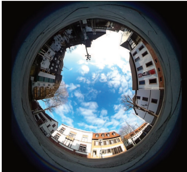
Abbildung 5: Unbearbeitetes Kugelpanorama

Durch die Weiterbearbeitung des Videos ist es möglich, dem Betrachter das Gefühl zu vermitteln, mitten auf dem Platz zu stehen. Der Betrachter sieht einen Ausschnitt des Bildes und kann sich durch Drehen des Smartphones oder durch die Mausbewegung im Video in alle Richtungen umsehen und den Platz auf diese Weise erkunden.