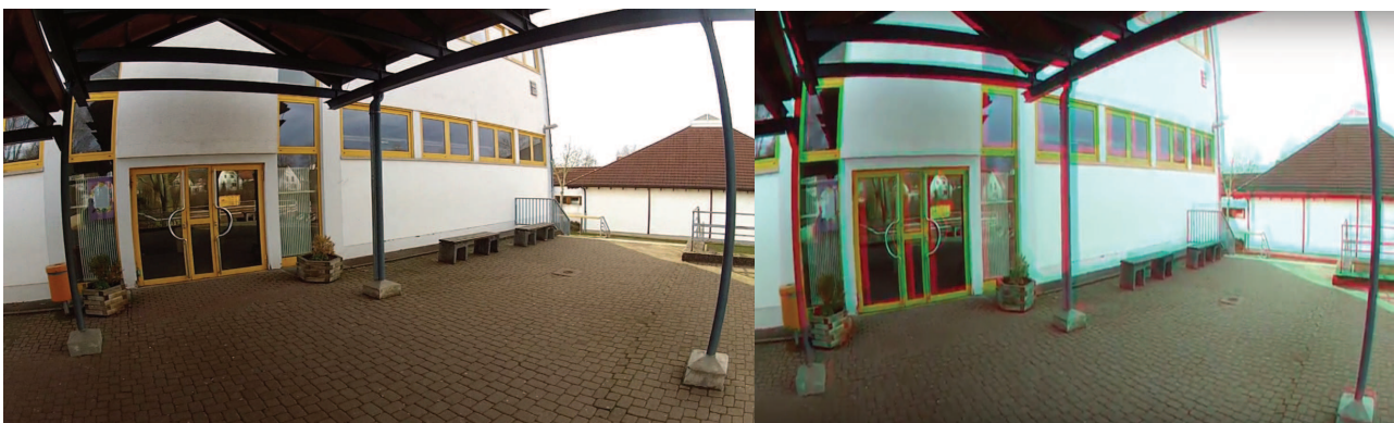
Abbildung 2: Ansicht im Original (links) und nach der Bearbeitung als anaglyphes 3D-Video (rechts)

Anaglyphe 3D-Videos bestehen aus zwei überlagerten Bildern, welche unterschiedliche Farben besitzen. Eines der Videos ist rot, das andere blau. Diese beiden werden überlagert, sodass mithilfe einer rot-blauen 3D-Brille ein dreidimensionaler Effekt entsteht. Vorteil dieses Verfahrens ist, dass für den Betrachter mit einer günstigen rot-blauen 3D-Brille auf allen denkbaren Bildschirmarten ein dreidimensionales Erlebnis möglich ist. Nachteil ist allerdings, dass die Farben des Originals nicht naturgetreu erkennbar sind und die Qualität des Videos daher leidet. Auf Abbildung 2 (links) ist zunächst ein Standbild aus einem der beiden unbearbeiteten Videos dargestellt. Zum Vergleich dazu zeigt Abbildung 2 (rechts) ein Standbild aus einem anaglyphen 3D-Video. Deutlich zu erkennen sind rote und blaue Streifen, welche aus der Überlagerung der beiden Videos resultieren. Darüber hinaus ist an anderen Stellen erkennbar, dass die Farben und die Qualität des Bildes durch die Bearbeitung nicht mehr optimal wiedergegeben werden.