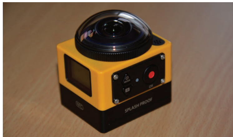
Abbildung 4: Kodak SP360

Neben dreidimensionalen Videos sind auch andere Erfassungsformen für eine dynamische Bestandsaufnahme denkbar. Die Kodak PIXPRO SP360 ist eine Kamera, welche mit einem Ultraweitwinkel und einer gekrümmten Linse einen Blickwinkel von 360^\circ mal 214^\circ einfangen kann. Die Kamera ist in folgender Abbildung dargestellt.