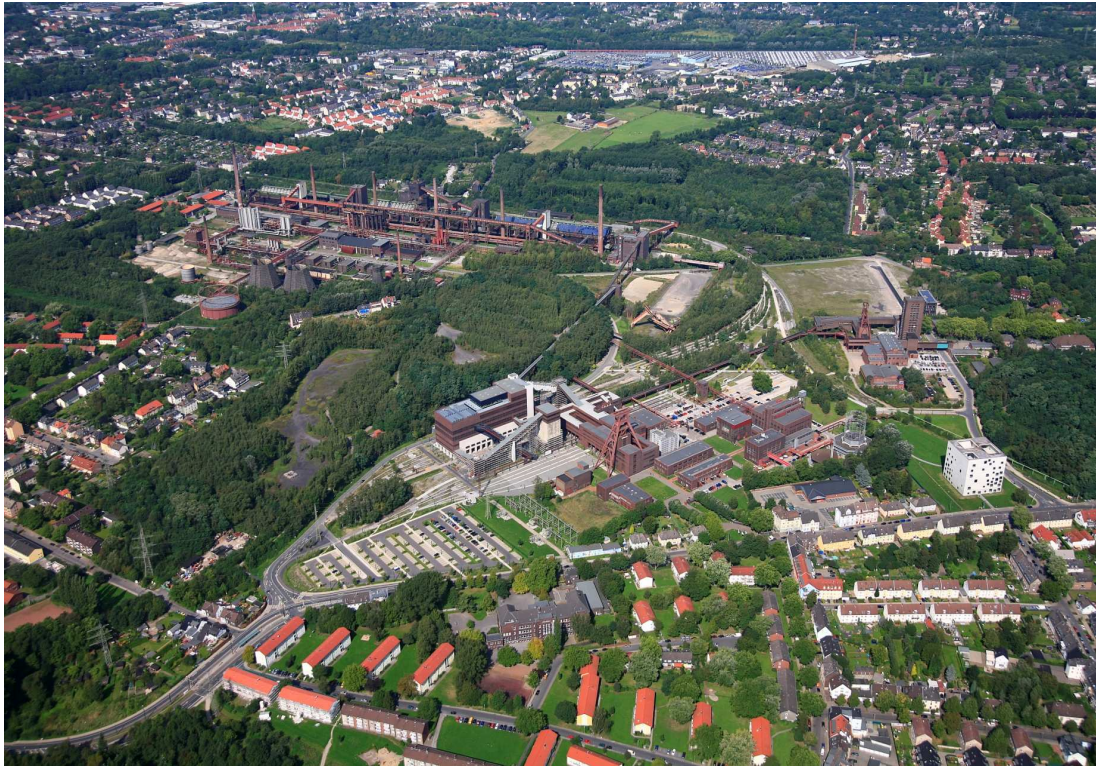
Fig. 1: Welterbe Zollverein

Mitarbeiter täglich bis zu 8.600 Tonnen Koks. Heute mutet die “Schwarze Seite” der Anlage mit ihrem Komplex von Bandbrücken, Kohlebunkern und Schornsteinen wie eine gigantische Skulptur an. Die Signatur der “Weißen Seite”, hier stehen alle Anlage zur Weiterverarbeitung des bei der Koksproduktion anfallenden Rohgases, sind mächtige Rohrleitungen, stählerne Behälter und Kühltürme.