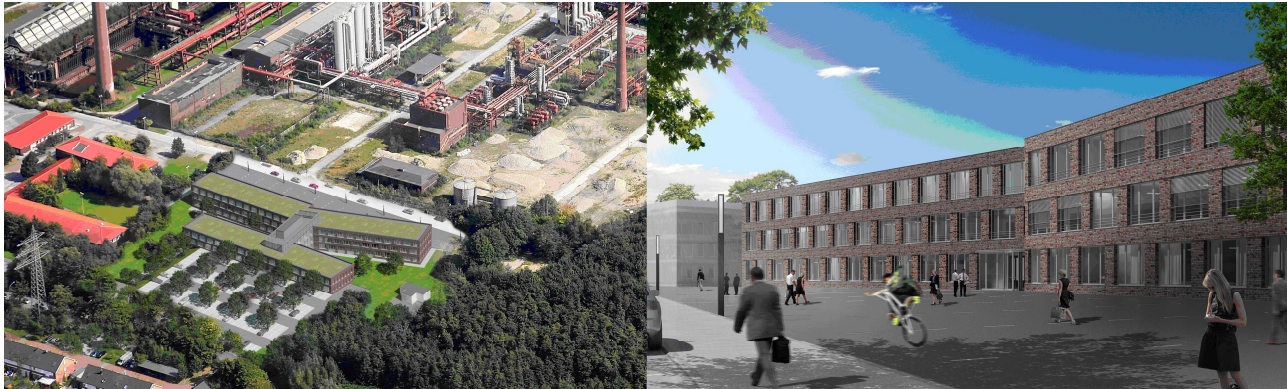
Fig. 3: Simulation Neubau RAG Montan Immobilien GmbH

Ziegelfachwerk-Architektur von Fritz Schupp. Das Bürogebäude im Westen des Kokereigeländes Zollverein wird im Dezember 2011 bezugsfertig sein. Auf einer Grundstückgröße von circa 14.200 Quadratmetern entsteht eine hochwertige Büroimmobilie in zwei bis dreigeschossiger Bauweise nach dem Greenbuilding Standard mit 7600 Quadratmetern Bruttogeschoßfläche.