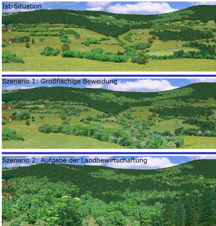
Abb. 2: Beispiel für Landnutzungsszenarien