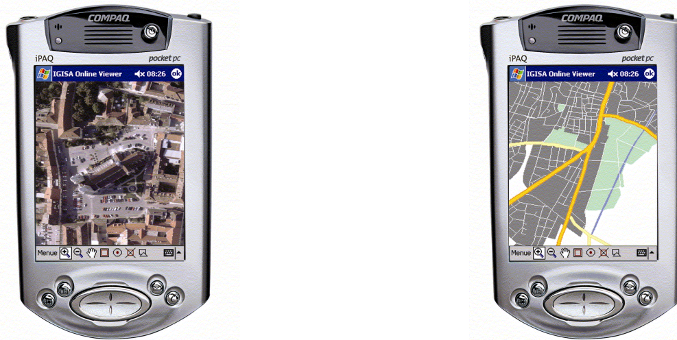
Abbildung 2: Compaq iPAQ mit Luftbild bzw. Strasseninformationen zur ersten Orientierung für Einsatzkräfte

Eine laufende, exakte Positionsbestimmung des mobilen Nutzers kann über einen im PDA installierten Satellitennavigationssystem garantiert werden. Auf Basis des amerikanischen Global Positioning System (GPS) welches in Zukunft durch das europäische Satellitensystem GALILEO unterstützt wird 1 , erfolgt eine Berechnung der Position, welche am Display des PDAs in Form eines Symbols (z. B. Fadenkreuz) angezeigt wird.